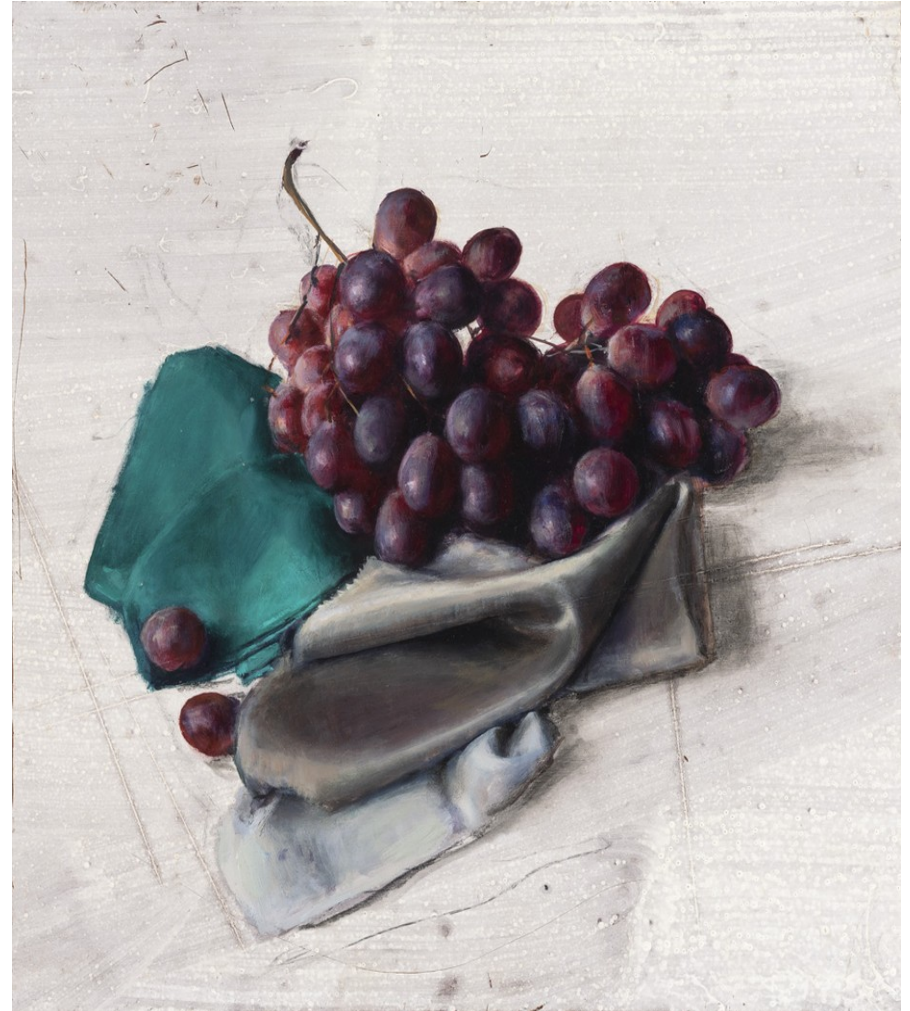
Uvas y seda 2018 Óleo y carbón sobre tabla 39 x 39 cm