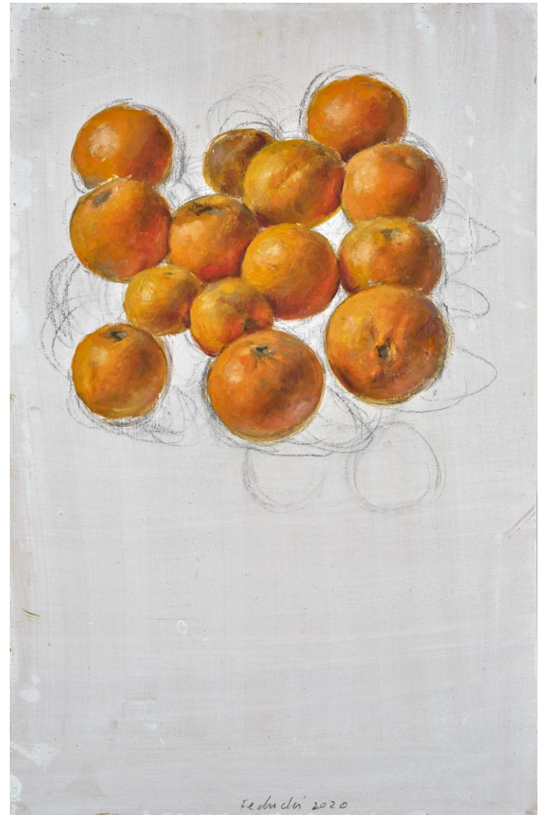
Naranjas I 2020 Óleo sobre tabla 61 x 39'5 cm