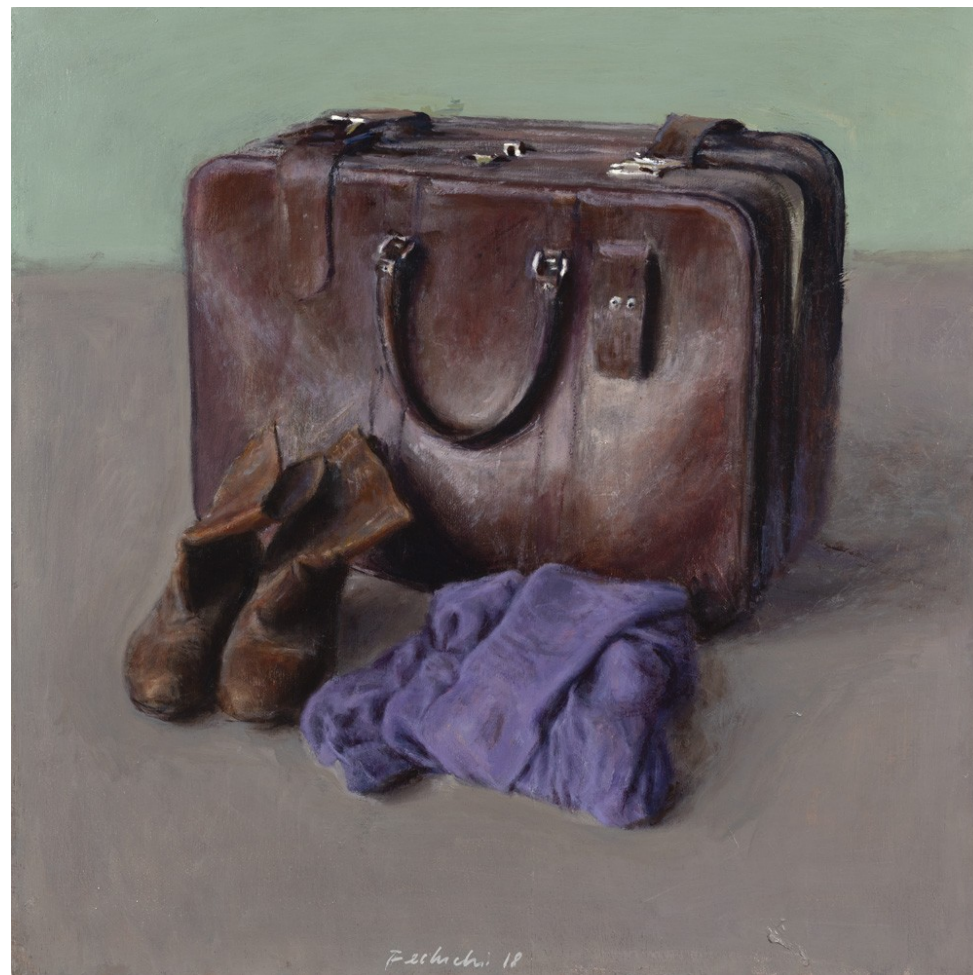
Maleta y botas I 2018 Óleo sobre tabla 50 x 50 cm