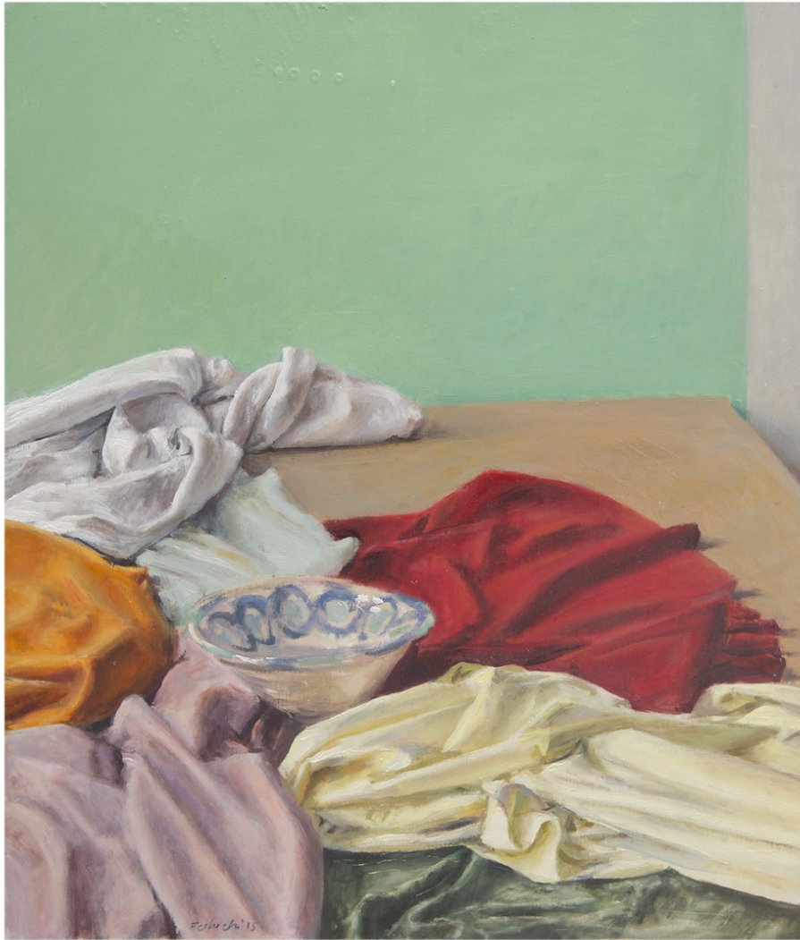
Mesa con telas 2015 Óleo sobre tabla 50 x 42 cm